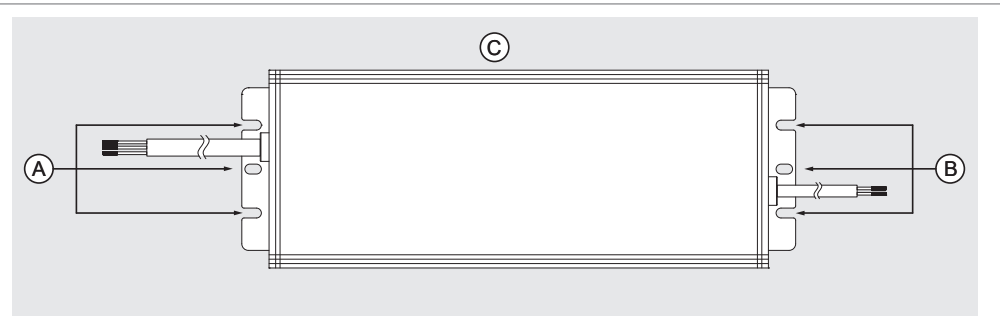
Fig. 2. Mounting Hole Locations